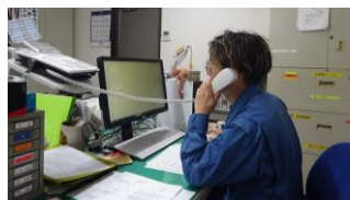
竣工検査の打ち合わせをしています